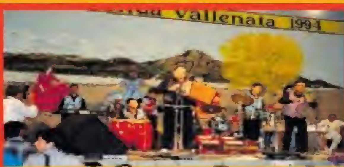
Presentacion Los Pimentosos na Valledupar Colombia 1994

“La Cacica”. La Nueva Fuerza tabata un di e prome bandanan di Aruba cu a presenta den exterior, cu hopi exito tambe. Elvia ta corda cu nan a haya invitacion pa presenta na Baranquilla y Cartagena. Den “Templo de Cleopatra” tabata un di e luganan cu nan a presenta varios biaha. Tambe nan a presenta riba un escenario riba beach cu tabata algo inolvidabel cu un acogida grandisimo. Nan exito e tempo ey tabata “Mi Banana”. Los Pimentosos a comparti escenario cu Binomio De Oro, Los Hermanos Zuleta,